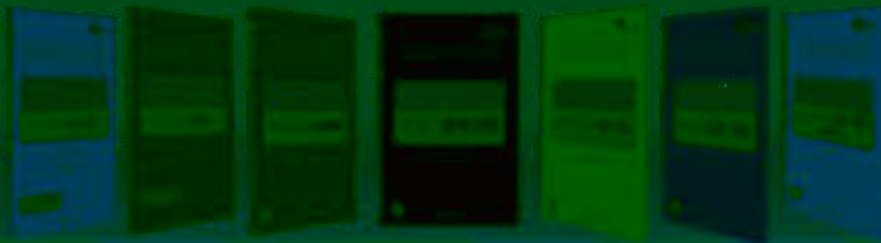
一体化课程教学设计 综合实践课